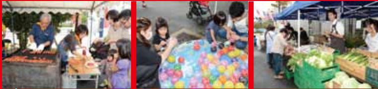
屋台(バザー、やきそば、餅……)にぎわい広場

娘…お母さん、掲示板に東部まつりのポスターが貼ってあったよ。 母…あら、もうそんな時期？秋なのねえ。 娘…去年行ったら、知ってるおじさんやおばさんが、お店をやってたよね。 母…そうよ。地域に住んでいる人たちが楽しいおまつりになるように協力して計画しているのよ。東部区民活動センターの前庭にはお店が出ているし、中に入ると踊りや歌の発表や、カレーが美味しいレストランや、作品展もあるし、最後は景品のかかった大じゃんけん大会もあって、すごく楽しいのよ。 娘…今年も落語家さんがきたり、プロのバイオリンも聴けるらしいよ。お父さんも誘って遊びに行こうよ。楽しみだなあ。