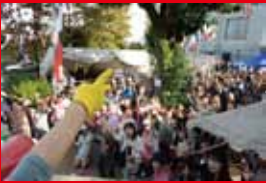
大じゃんけん大会 5日15時~