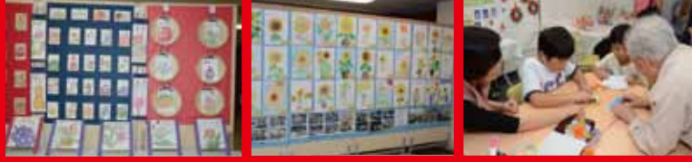
書道、絵画、手芸、工芸など。展示の広場