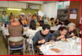
カレー、みつめめ。11時開店。レストラン「アカシア」