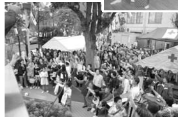
ファイナーレじゃんけん大会