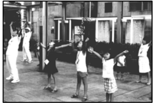
夏休み恒例のラジオ体操