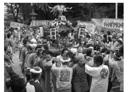
9月18日氷川神社祭礼 東中野連合宮入りの様子

支援を頼みたい方は、 電話 336312949 (月、金、10時~12時) にお電話をください。